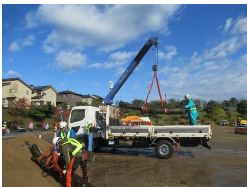
【石川県防災総合訓練】

我々、造園業は緑を通して、皆様に憩いとやすらぎをお届けすることは大切な役割ですが、災害などの緊急時に即座に対応することはそれ以上に大切なことであると思っております。石川県との災害協定の締結により、皆様のお役に立てる機会が増えたことは非常に有意義なことであり、今後とも、微力ながら少しでも地域に貢献できる協会でありたいと考えております。