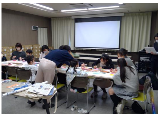
【壁新聞作成の様子】

アレルギーを気にせず、食事を楽しむことができました。発表会では病院の先生にも参加していただき、感想などを述べました。