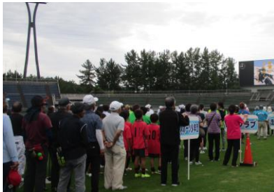
参加者のみなさん (令和7年度)