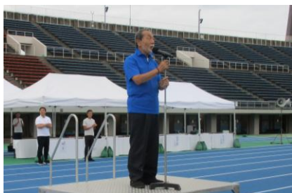
関戸委員長開会宣言 (令和7年度)

8月下旬から10月中旬にかけて、西部緑地公園陸上競技場などを会場に、総合開会式を含めて大会を実施します。