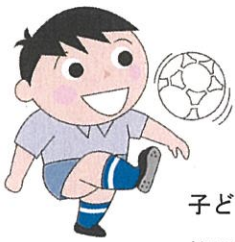
子ども会 親子サークル 放課後児童クラブ

運動が大好きな方はもちろん、運動が苦手と思っている方でも、「体を動かすことの楽しさ」を体験できる出前講座です。健康づくりに取り組んでいるサークルや団体ならば、どなたでも応募できます。老人クラブ、健康クラブ、町内会主催の健康講座、子育てサークルや放課後児童クラブ、小学校の育友会(PTA)のイベントなどに、健康わくわく出前講座をお役立てください。(講師1名分の派遣にかかる費用が無料です。)