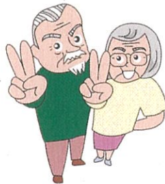
健康クラブ、老人会