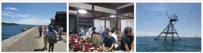
※行程については都合により一部変更となる場合があります。