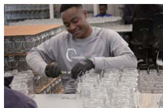
ソーラーランプ製造 （南アフリカ・ソネングラス社）