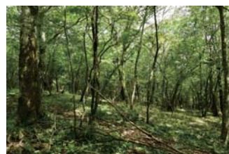
里山保全のために採取した枝 （能登・金沢）