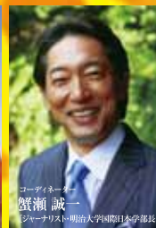
コーディネーター 蟹瀬 誠一 [シニアリスト-明治大学国際日本学部長]