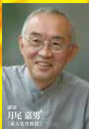
講演 月尾 嘉男 [東大名名誉教授]