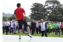
「ゆーりんピック」の開催