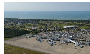
航空ネットワークを活用した交流促進