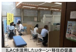
ILACを活用したUターン・移住の促進