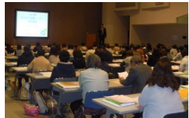
防災士資格取得のための研修