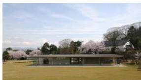
金沢城復元整備(鶴の丸休憩館)