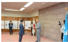
いしかわ次世代産業創造ファンド交付式

世界最大規模の産業技術の展示会「ハノーファー・メッセ」へのCFKパレーとの共同出展(H28.4月) 炭素繊維複合材料建築等用途拡大研究会の開催(5回)