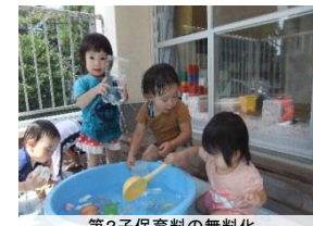
第2子保育料の無料化