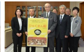
ひやくまん穀の名称決定