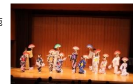
伝統芸能の体験機会の提供