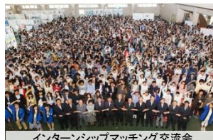
インターンシップマッチング交流会