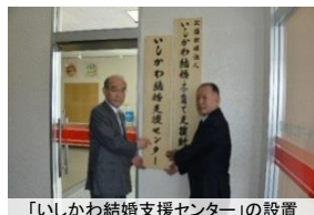
「いしかわ結婚支援センター」の設置