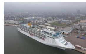
クルーズ船の定着促進