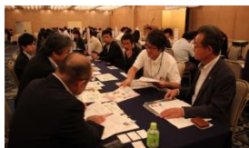
いしかわ旅行商品プロモーション会議

※MICEとは、Meeting(会議・研修・セミナー)、Incentive tour(報奨・招待旅行)、Convention/Conference(大会、学会、国際会議)、Event/Exhibition(イベント、展示会)の総称