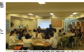
首都圏における移住促進イベント