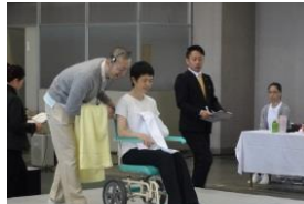
「いしかわ介護フェスタ」の開催