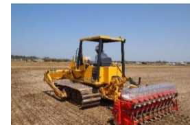
多機能ブルドーザ水稲直播栽培