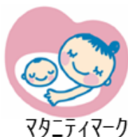
マタニティマーク