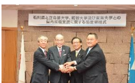
県外大学との就職支援協定の締結