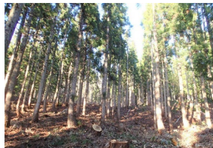
県有林における利用間伐の状況

今後、県有林におけるクレジットの取得・売却に関するノウハウ等を取りまとめ、県のホームページ等で広く情報共有するとともに、県内の民有林で森林J-クレジットの取組みが進むように支援していく予定です。