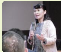
能登乃國ゆするぎ塾

石川県災害ボランティア協会から講師を招き、さまざまな災害や地域防災の基礎知識をお話いただきました。避難時に利用できる簡易トイレや新聞紙スリッパを作るワークショップも好評でした。