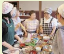
NPO 法人 竹の浦夢創塾

新しい体験メニュー「味噌玉づくり」の具材や組み合わせ、味噌や塩分の量、運営方法などをワークショップで学びました。キャンディー風の可愛いパッケージも付加価値を高める要素だと気づきました。