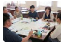
石川地域づくり塾

地域リーダー育成を目的とした石川地域づくり塾を受講することができます。1年間をとおした連続講座です。