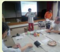
かなざわご近所コラボプロジェクト

郷土史の編集方法について協会コーディネーターから指導を受けました。テーマや項目の選び方、資料収集などの他、住民を巻き込む意味や読まれるための工夫の重要性についても学びました。