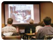
コーディネーター派遣制度

専門家を招き、ワークショップや勉強会を開催。地域づくり活動への助言が受けられます。当協会から専門家・コーディネーターを紹介できます。