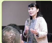
能登乃國ゆするぎ塾

石川県災害ボランティア協会から講師を招き、さまざまな災害や地域防災の基礎知識をお話いただきました。避難時に利用できる簡易トイレや新聞紙スリッパを作るワークショップも好評でした。