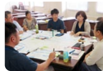
石川地域づくり塾

地域リーダー育成を目的とした石川地域づくり塾を受講することができます。1年間をととした連続講座です。