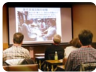
コーディネーター派遣制度

専門家を招き、ワークショップや勉強会を開催。地域づくり活動への助言が受けられます。当協会から専門家・コーディネーターを紹介できます。