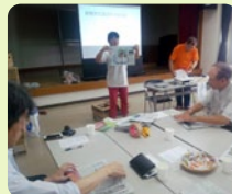
かなざわご近所コラボプロジェクト

郷土史の編集方法について協会コーディネーターから指導を受けました。テーマや項目の選び方、資料収集などの他、住民を巻き込む意味や読まれるための工夫の重要性についても学びました。