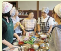
NPO 法人 竹の浦夢創塾

新しい体験メニュー「味噌玉づくり」の具材や組み合わせ、味噌や塩分量、運営方法などをワークショップで学びました。キャンディー風の可愛いパッケージも付加価値を高める要素だと気づきました。