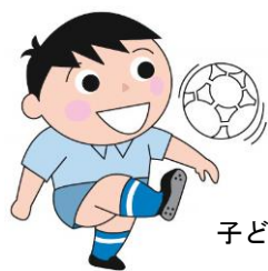
子ども会 親子サークル 放課後児童クラブ

運動が大好きな方はもちろん、運動が苦手と思っている方でも、「体を動かすことの楽しさ」を体験できる出前講座です。健康づくりに取り組んでいるサークルや団体ならば、どなたでも応募できます。老人クラブ、健康クラブ、町内会主催の健康講座、子育てサークルや放課後児童クラブ、小学校の育友会(PTA)のイベントなどに、健康わくわく出前講座をお役立てください。〈講師1名分の派遣にかかる費用が無料です。〉