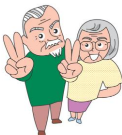
健康クラブ、老人会