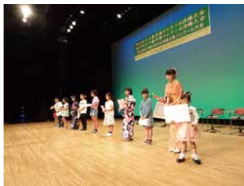
【民謡、民舞コンクール】

現在、世の中は新型コロナウイルスの蔓延による感染拡大防止対策等で大変苦勞していますが、石川県民謡協会はモチベーションを失うことなく精進してまいります。