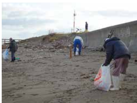
【秋のクリーンキャンペーン】