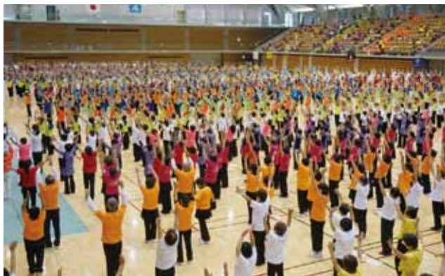
健民さわやか体操