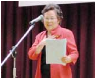
結果発表(審査委員長)