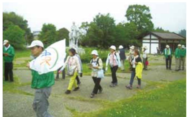
中能登町でのウォーキング