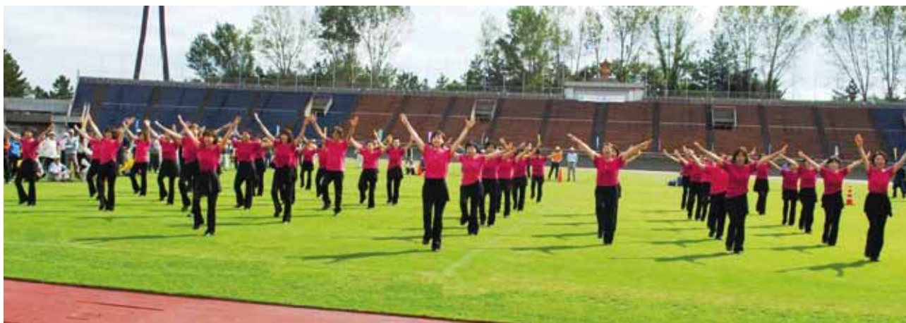
かがやきパラダイス