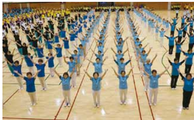
リズムダンス「なかよし音頭」