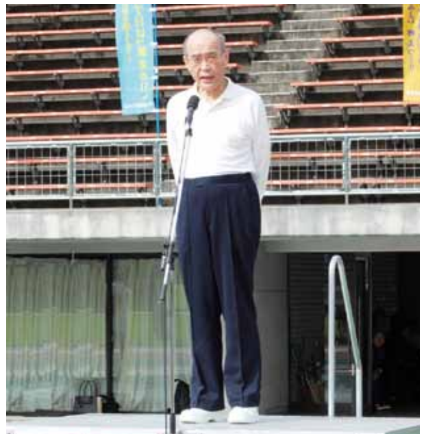
挨拶(谷本正憲県知事・本部長)