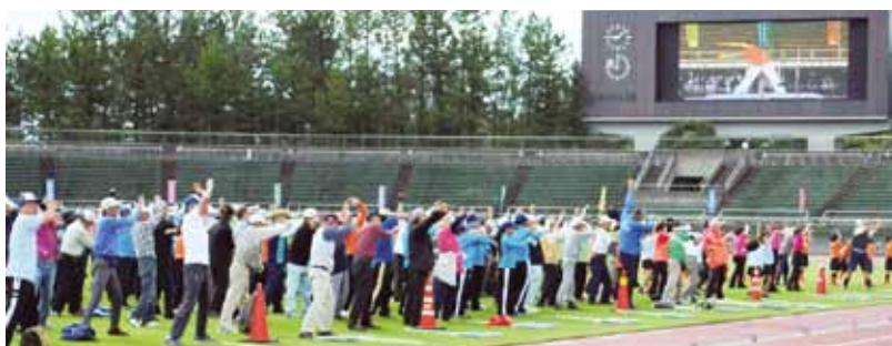
健民さわやか体操