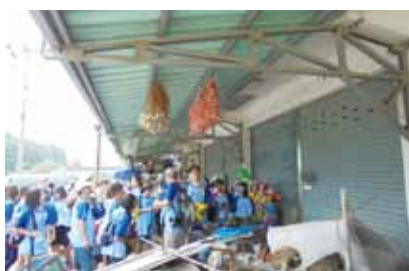
フン落下防止板（ニンニクの奥）

周辺はニンニクとタマネギの産地で、ニンニクを満載したトラックが行き交い、軒下にはニンニクが干されている中、たくさんのツバメが飛び交い、営巣が確認できました。