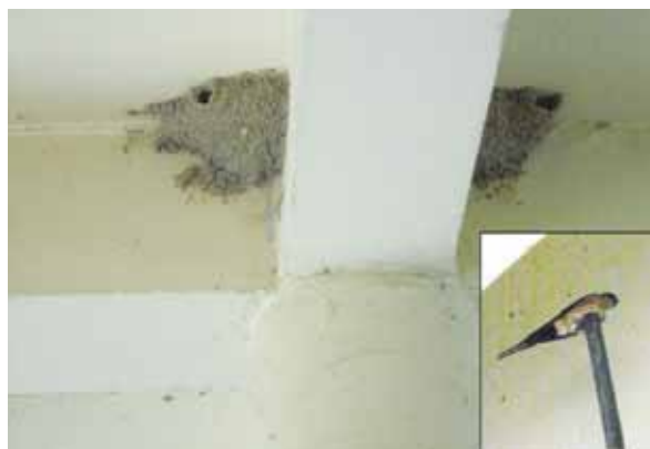
天井の巣とコシアカツバメ