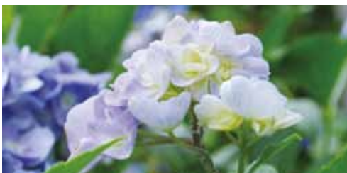
沿道に咲くアジサイ