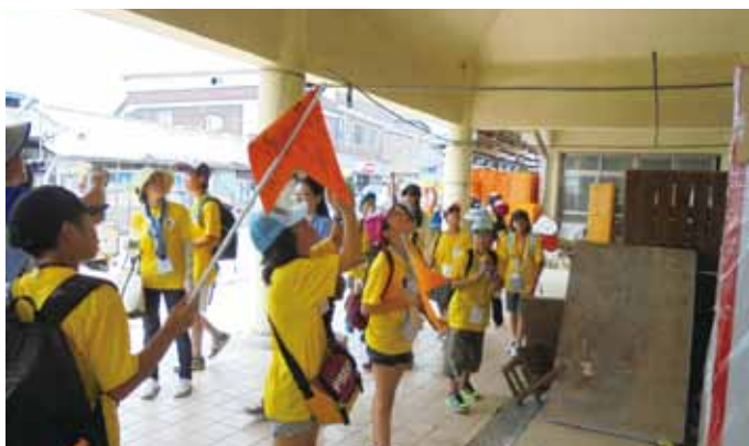
大きな建物の天井の巣を調査