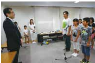
決意表明（松波小学校）