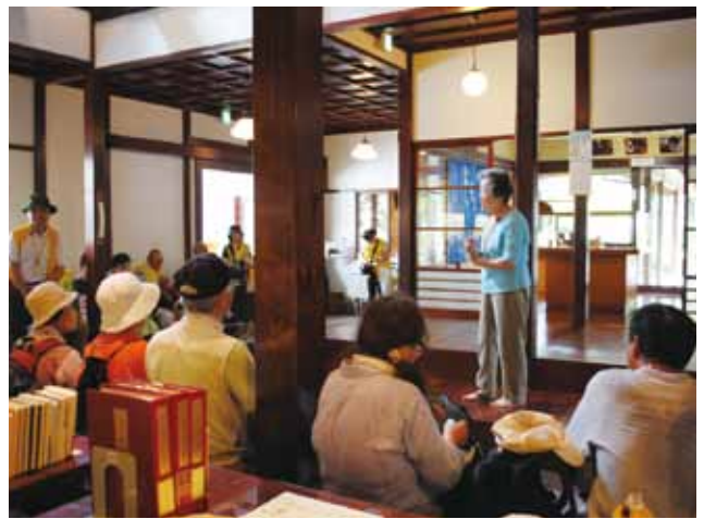
「山中節を聴きました」(芭蕉の館)