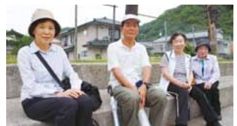
「楽しかったです」(ゴールにて)