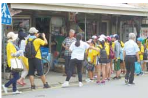
雑貨店前での調査