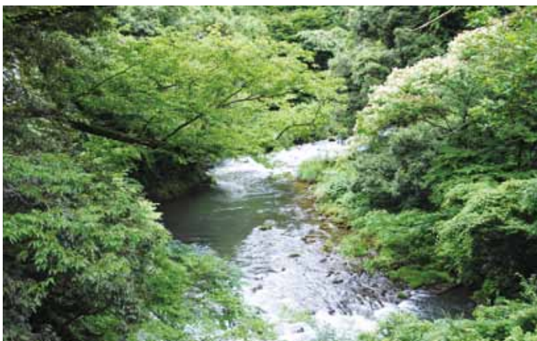
鶴仙溪 (こおろぎ橋より)