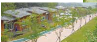
ウポエコビレッジユースホステル（左・上）