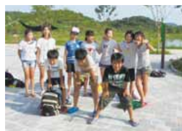
伝統船といかだの乗船体験