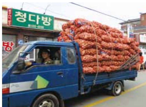
ニンニク満載のトラック