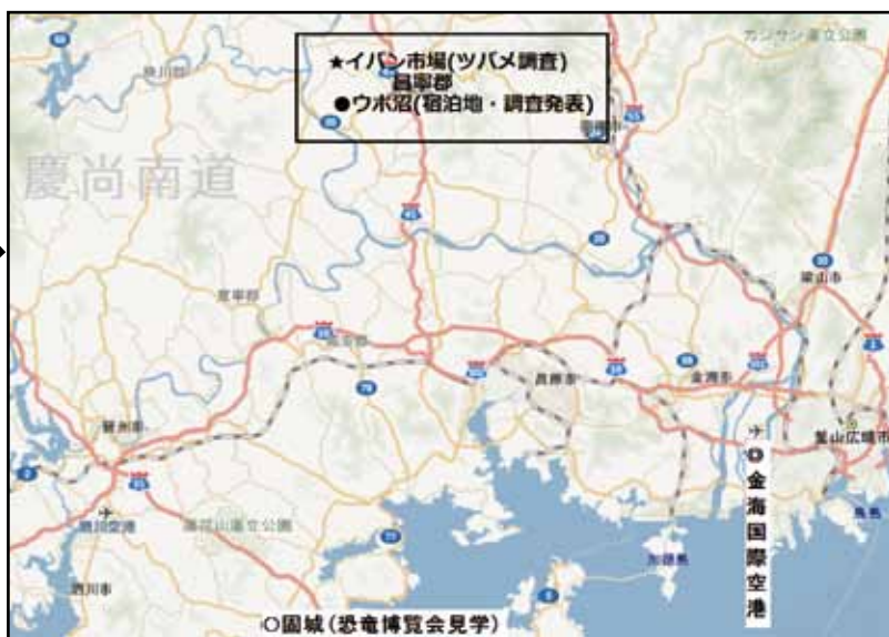
開催地地図(図上部中央付近)