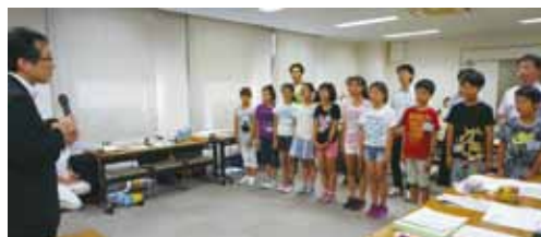
木島事務局長挨拶

25日に名古屋空港から金海国際空港（釜山）に降り立ち、台湾の参加者と合流後、ウポエコビレッジユースホステルに入りました。