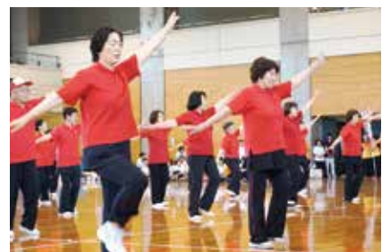
野々市椿健康クラブ