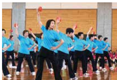
金沢中央健康クラブ