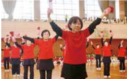
美川グリーンスポーツクラブ星組