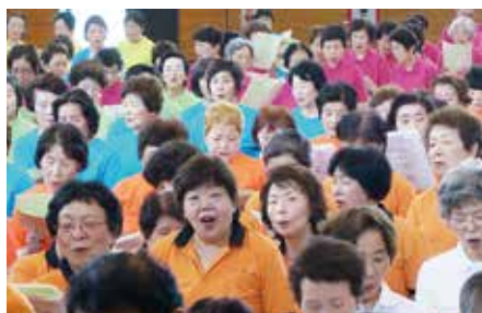
歌唱「真っ赤な太陽」等