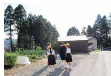
金沢市立不動寺小学校のツバメ調査