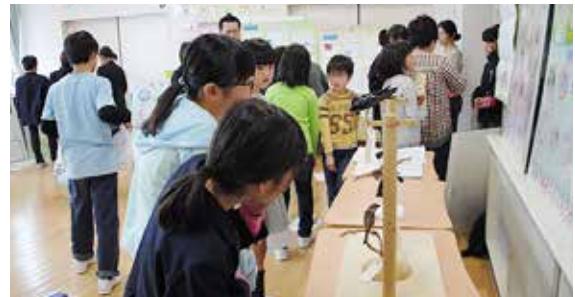
小松市立日末小学校の学習会