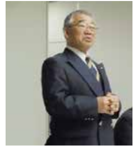
閉会挨拶(小山副会長)