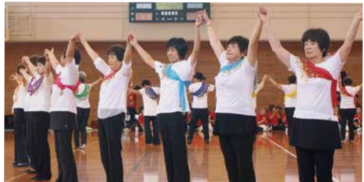
むつみ健康クラブ