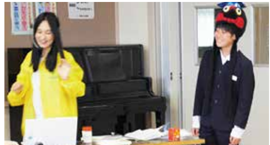
金沢市立馬場小学校の学習会