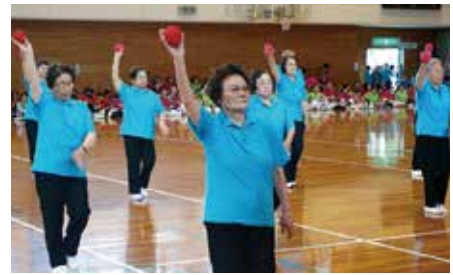
山中さわやか健康クラブ