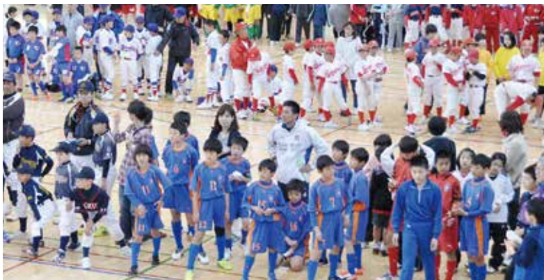
5mを往復し15秒間で何m進ことができるかを挑戦します！