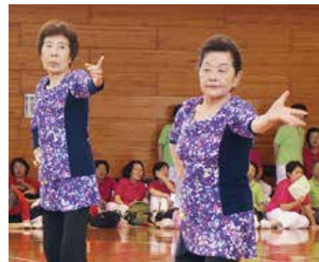
辰口健康クラブ ”スマイル”