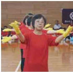
寺井末広健康クラブ