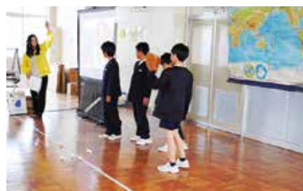
能美市立辰口中央小学校の学習会