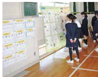
市立山代小学校の学習会