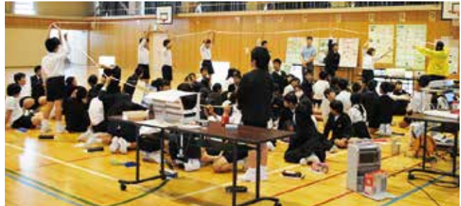
金沢市立泉小学校の学習会