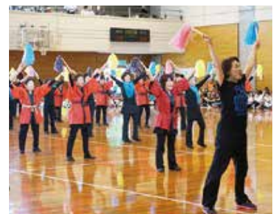
根上はまなす健康クラブ