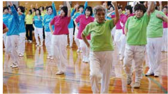
全体演技「オー・シャンゼリゼ」

各クラブの発表では、18プログラム、延べ891人が、それぞれ趣向を凝らした演技を披露しました。