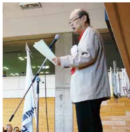
開会挨拶 (田川会長)