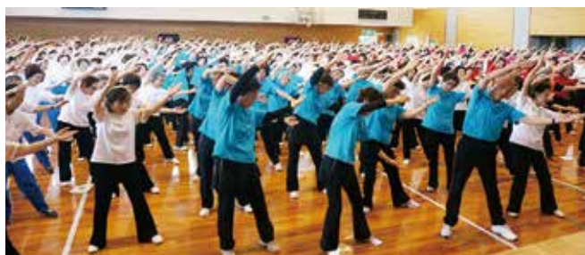
健民さわやか体操