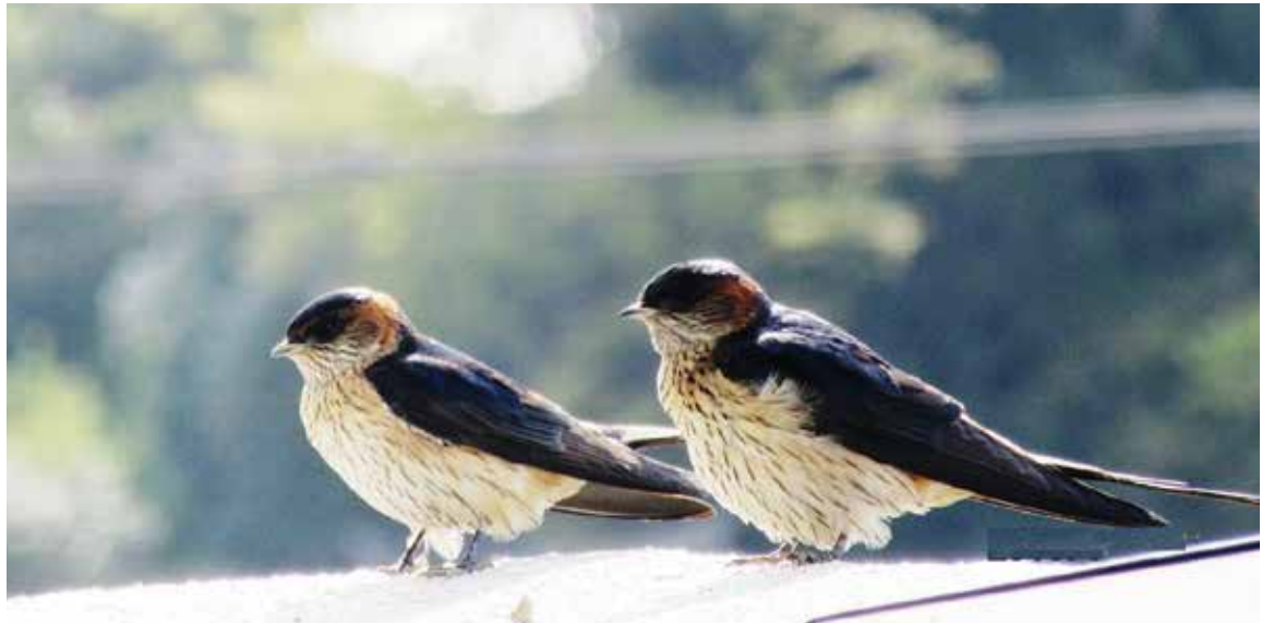
コシアカツバメ