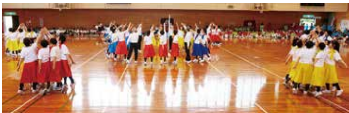
小松すこやか体操クラブ