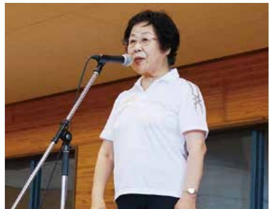
次回開催挨拶（喜田会長）