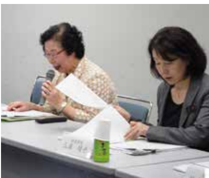
左 能木場副本部長、右 三浦副本部長