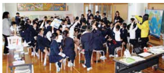
七尾市立東湊小学校の学習会