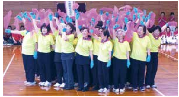
松任スポーツクラブ