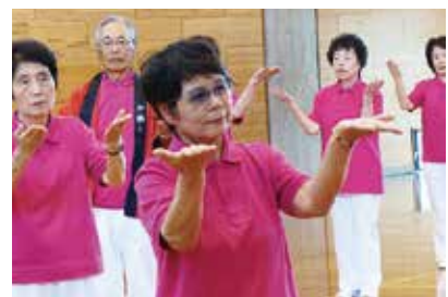
野々市若葉健康クラブ