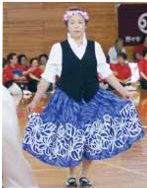
鶴来チェリークラブ