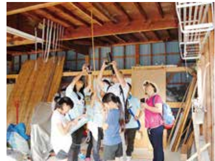
小松市立中海小学校での交流会と合同ツバメ調査