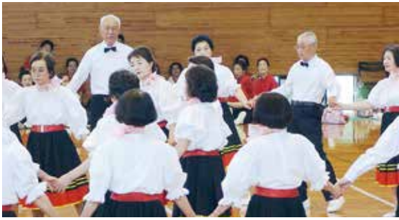
高砂悠々健康クラブ