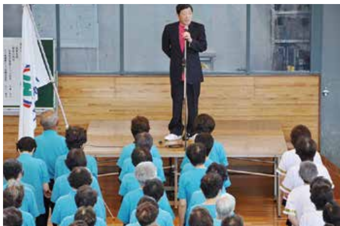
開会挨拶 (齊藤会長)