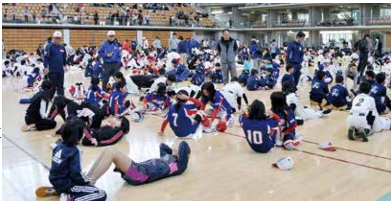
30秒間で何回上体を起こすことができるかな？

この理念をスポーツ少年団のこれから進むべき方向性ととらえ、石川県スポーツ少年団も未来に向かって一歩ずつ着実に進んでいきたいと考えています。