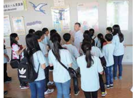
台湾高美小学校の副本部長表敬訪問と原画展視察