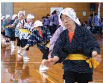
ささゆり健康クラブ