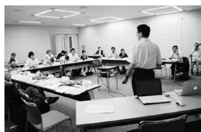
講演後の質疑の様子