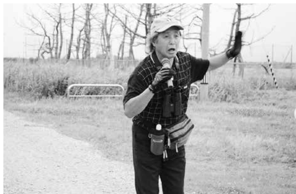
日本野鳥の会石川の指導