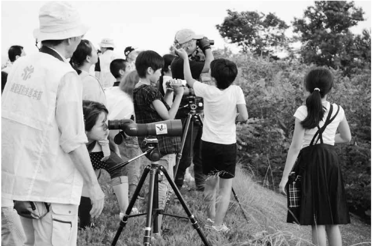
ねぐらのすぐ前での観察

日没後、午後7時30分ごろになると、何千羽ものツバメの群れが、いくつもいくつも集まってきて、すぐ前の葦原は、ツバメのさえずりでいっぱいになりました。