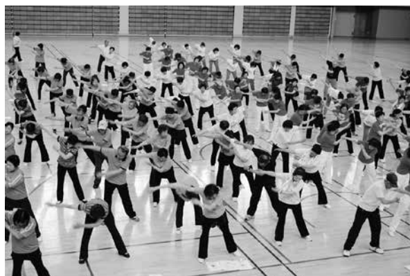
健民さわやか体操