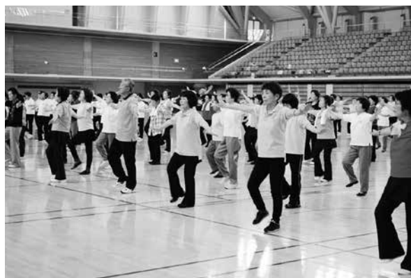
かがやきパラダイス