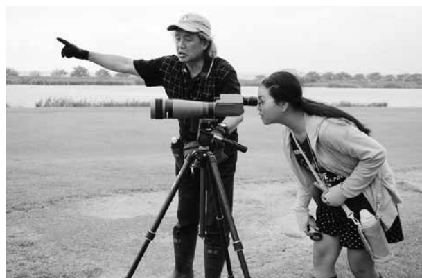
河北潟での野鳥観察