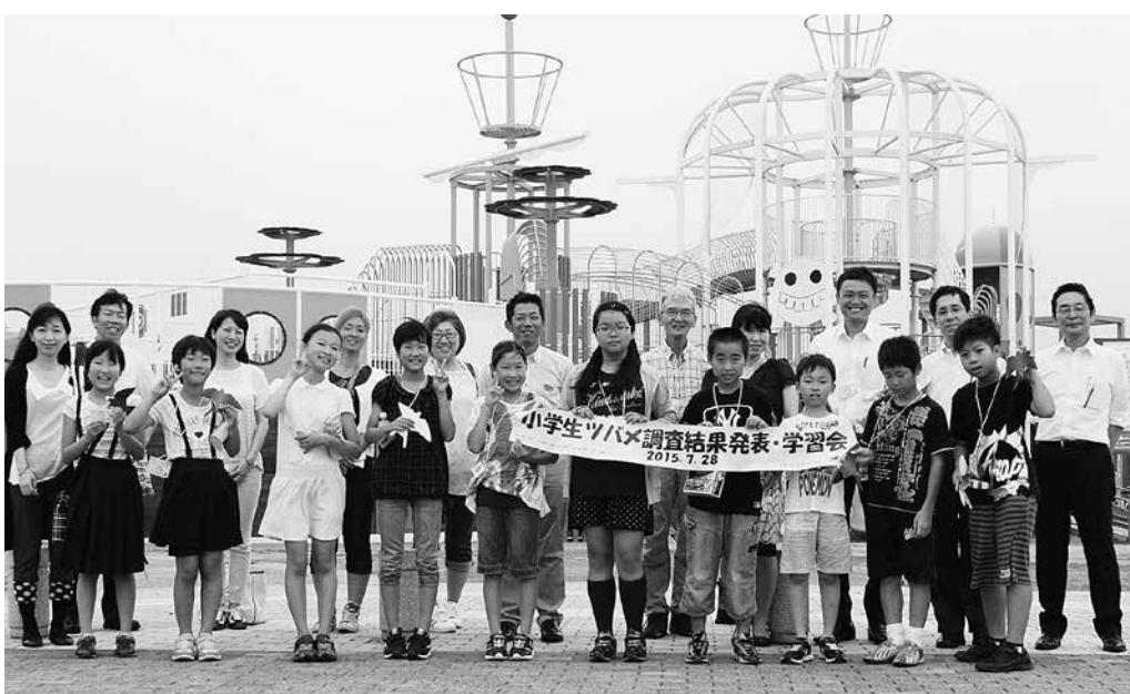
参加者の皆さん（ツバメのねぐら観察学習の前、内灘町サイクリングターミナルにて）