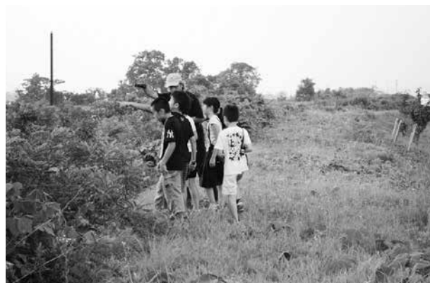
ツバメのねぐら付近