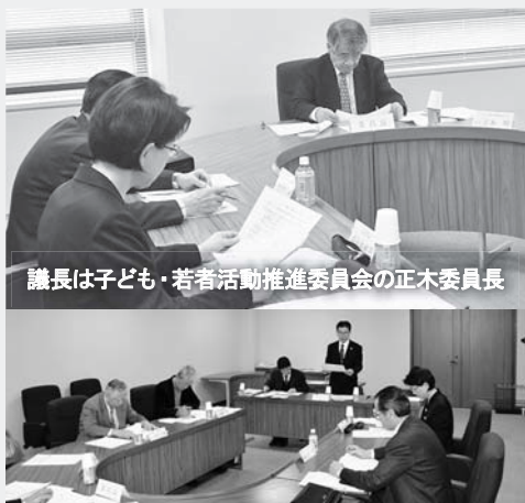
議長は子ども・若者活動推進委員会の正木委員長