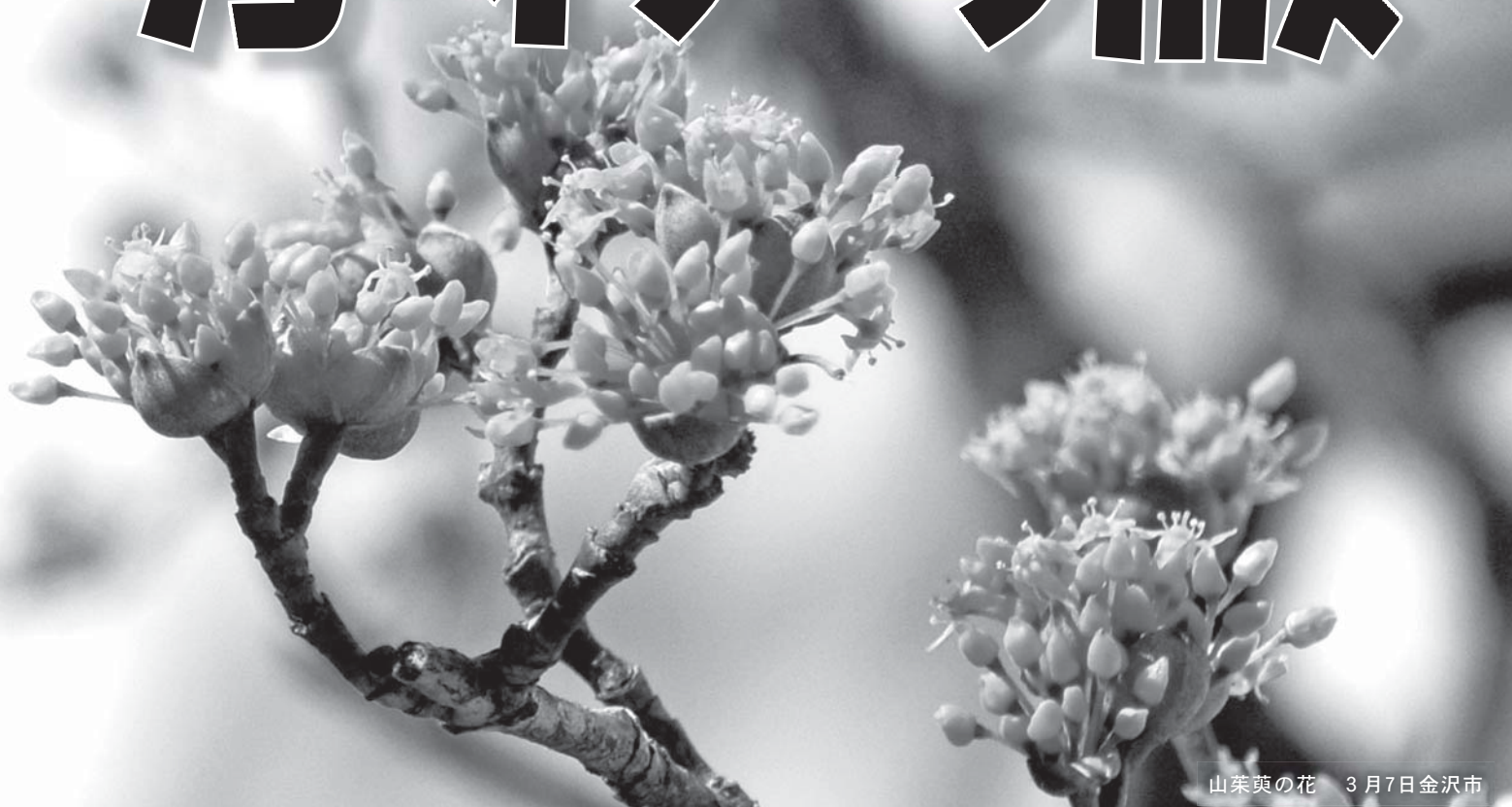
山茱萸の花 3月7日金沢市

毎月7日は「健康の日」です。 ～歩くことから健康づくり、運動することを習慣にしましょう～