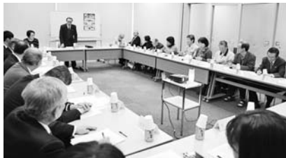
ふるさとづくり推進委員会 3.23