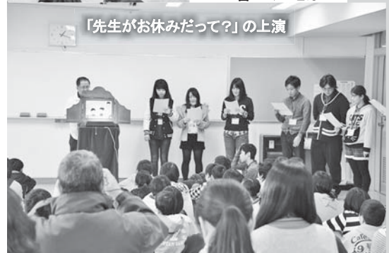
「先生がお休みだって?」の上演