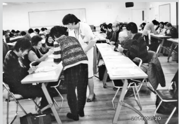
高砂大学 紙ざいく体験