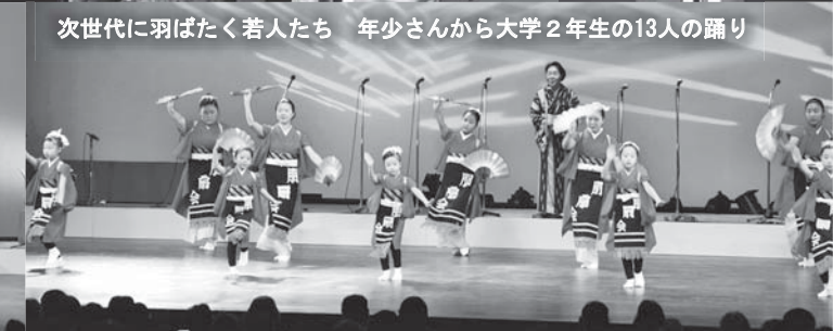
次世代に羽ばたく若人たち 年少さんから大学2年生の13人の踊り