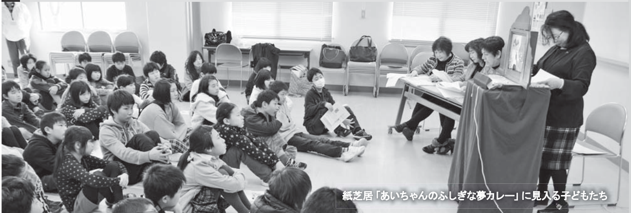
紙芝居「あいちゃんのふしぎな夢カレー」に見入る子どもたち

平成26年度の子ども会交歓フェスティバル、石川県少年団体協議会加盟団体交流・交歓会が2月28日(土)から2日間の日程で羽咋市の国立能登青少年交流の家において開催されました。「子どもの手による子ども会を」をテーマに開催された今年の交歓会には、県内各地域の子ども会などに所属する小学校4年生から中学校3年生までの児童生徒66名とその保護者など合わせて約100名が参加しました。また、全体の指導は子ども会のOBとOGであるジュニアリーダー・シニアリーダーの17名の若者が担当しました。