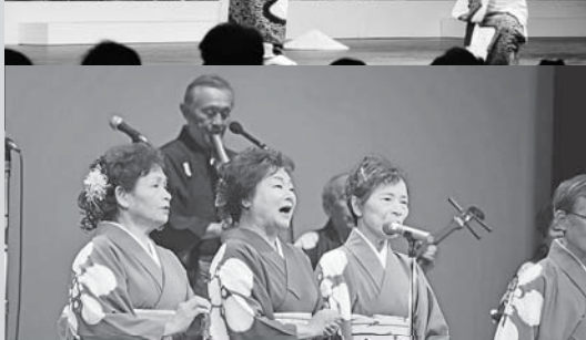
民謡でめぐる北陸新幹線「百万石音頭」