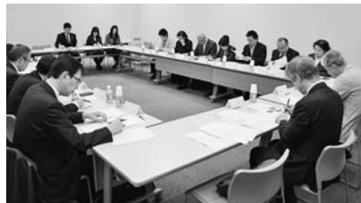
子ども・若者活動推進委員会 3.24