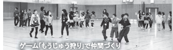
ゲーム「もうじゅう狩り」で仲間づくり