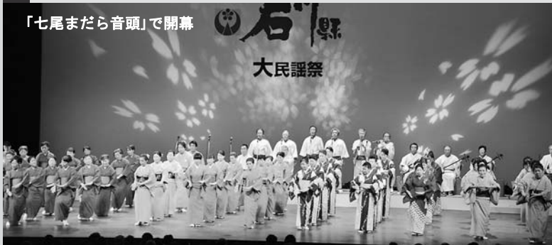
「七尾まだら音頭」で開幕