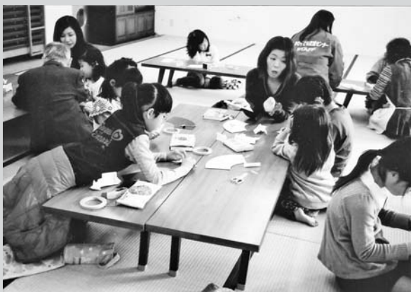
いしかわ子ども交流センター 紙ざいく教室

昨今、青少年の健全育成や社会貢献活動として、いろいろな活動が進められていますが、「言葉がけ運動」こそ、社会教育活動や福祉活動の原点であり、ボランティア活動の源であり、“ありがとう”という感謝の言葉こそが、ボランティアの心を育てる糧となるのです。