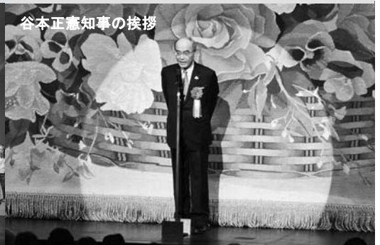
谷本正憲知事の挨拶