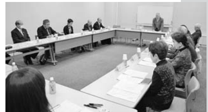
健康づくり推進委員会 3.24

健民運動推進本部は、今年度実施した50周年記念事業をはじめとして今年度事業全体を振り返るとともに、平成27年度の活動の方向性などを協議するため、3月23日と24日の2日間で次の活動推進委員会を開催しました。会場は県庁1階102会議室。