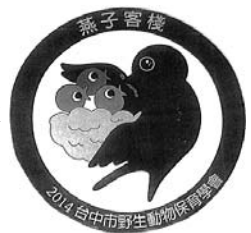
台湾のお宿シール