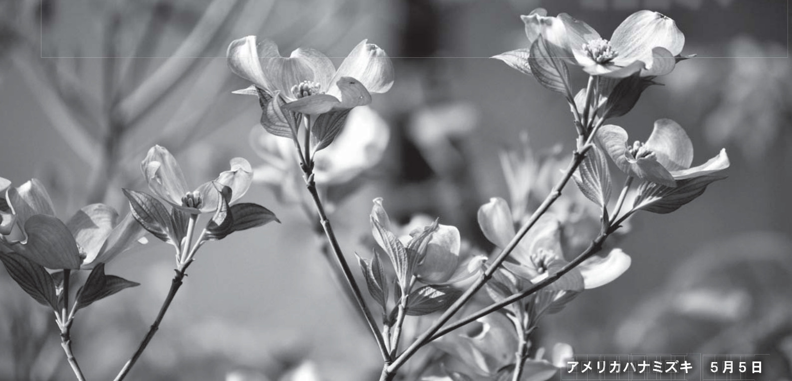
アメリカハナミズキ 5月5日

毎月7日は「健康の日」です。 ～ 歩くことから健康づくり、運動することを習慣にしましょう ～