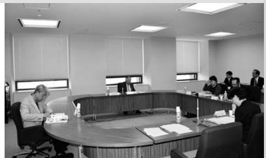
1106会議室 H26. 5. 7

5月7日(水)、県庁11階1106会議室において、「健民運動50周年記念大会表彰選考委員会」が開催されました。7月27日に県立音楽堂で開催される50周年記念大会における知事表彰受賞者として各本部構成団体等から推薦のあった個人と団体について、活動歴や業績等について慎重に選考が進められ、特別功労者14名、優秀実践活動表彰(団体の部)19団体、同(個人の部)60名、感謝状7団体、特別感謝状3団体が選考されました。