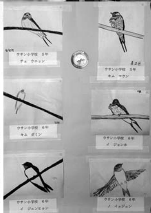
ウサン小児童の絵