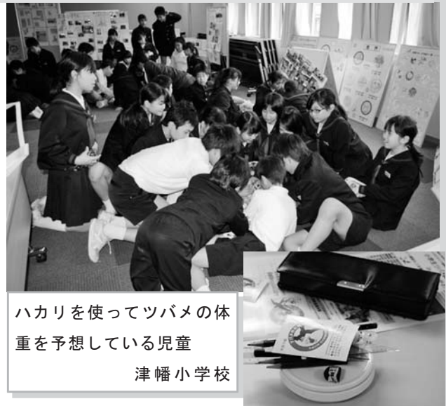
ハカリを使ってツバメの体重を予想している児童 津幡小学校

ツバメ学習会は、ツバメ調査が始まった理由、各小学校のこれまでの調査の推移などに加えて、ツバメの生態をクイズ形式で学習する事前、事後学習です。また、巣の見分け方、ツバメの鳴き声の聞き分け方などを、ツバメのはく製、本物のタマゴの殻、巣、ツバメの映像、音声などを使って紹介しています。5月1日に開催された津幡町立津幡小学校では、71名の児童が参加し、ツバメの体重あてクイズに、筆箱を使ってツバメの体重を予想しました。100gぐらいから、500gぐらいと答えた子どもが多く、実際には20gであることを知り、手のひらに1円玉20個を載せてみると、「こんなに軽いのか」と驚いていました。