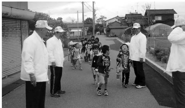
地域見守り隊（毎日の子どもの登校時）