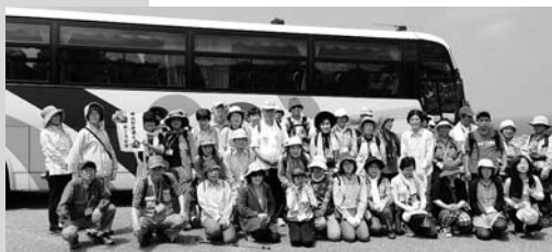
H25. 6. 8 美しい石川を歩く「珠洲岬コース」集合写真