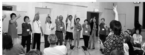
健康わくわく出前講座 H25.5.24

子どもから大人まで、幅広い年齢層の県民を対象に身体を動かすことの楽しさを体験できる出前講座を実施し、自らの健康づくりの一層の推進を図ります。