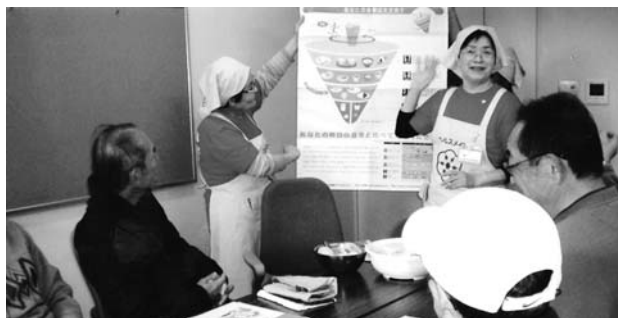
バランスの良い食事についての講話 「男性のための料理教室」事業にて