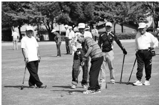
石川県知事杯グラウンド・ゴルフ大会 H25. 9. 24

昭和35年6月に発足した「石川県老人クラブ連合会」は、現在1,440余のクラブと11万3千人の会員を擁する県内最大の団体であり、県内19市町老人クラブ連合会と連携しながら、全国三大運動の「健康づくり」「地域支え合い」「社会奉仕」に取り組んでいます。しかしながら、近年の少子高齢化社会の進展により、65歳以上の高齢者が3,000万人、認知症高齢者が800万人時代を迎える中、地域での人と人との関わり合いが希薄となっており、高齢者の「孤立・孤独死」が社会問題化しています。こうした中、高齢者が互い励まし合い、支え合いながら長寿の喜びを実感できる社会の実現を目指して、平成26年度から新たな運動を展開したいと考えています。