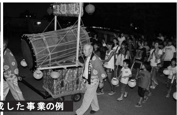
米泉校下虫送り事業の復活（金沢市）