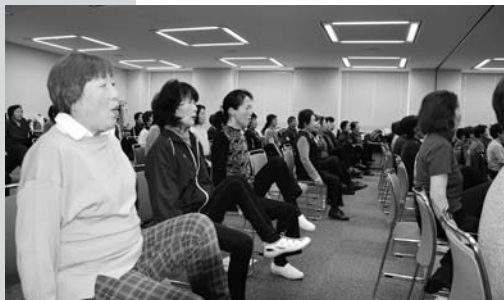
H26. 3. 3 県庁1102会議室での指導者講習会

生涯をとおして生きがいのある生活を送れるよう、「健康・生きがいづくり講座」として、健康体力づくりに関わる指導者やリーダーを養成して健康体力づくりの一層の推進をねらいに、3月に実施する予定です。市町の健康体力づくり担当職員の方や健康クラブ、老人クラブ等のリーダーや指導者の方が対象としています。ご参加ください。