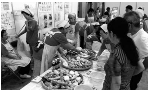
1日に食べた野菜を量る体験 「いしかわの農林漁業まつり」にて

また、各市町の健康づくり・栄養改善施策と協働して貧血予防、減塩、骨粗しょう症予防、朝食摂取の推進など、時代時代の課題に応じた活動に取り組んできました。特に近年は、メタボリックシンドロームを始めとした生活習慣病予防や食育に重点をおき、ライフサイクルに応じた活動を展開しています。