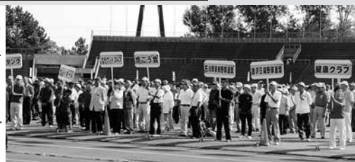
太陽と緑に親しむ健民祭「総合開会式」H25.9.23

9月23日(火・秋分の日)を中心に、子どもから高齢者まで、だれもが参加できる各種スポーツ大会を開催し、県民が健康づくりに親しむ機会を提供します。西部緑地公園陸上競技場で総合開会式を行い、県内各地で15種目以上の大会を実施します。