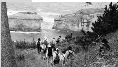
H25. 11. 4 美しい石川を歩く「加賀海岸コース」