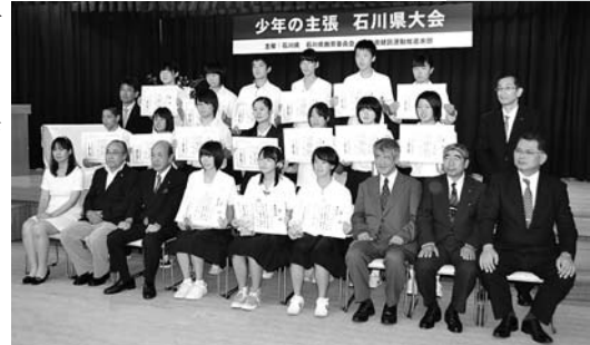
少年の主張石川県大会 H25. 9. 28

中学生が日常の体験から学んだことを自分自身のことばで発表する「少年の主張大会地区大会」を県内各箇所で開催し、各地区代表による県大会を9月27日(土)に開催します。この大会は、中学生世代に社会参加意識の醸成を図るとともに、多くの大人に現代の中学生への理解を深めてもらうねらいで開催しています。