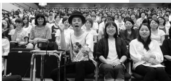
絵本センターのつどい 地場産業振興センター H25. 7. 9

子どもへの絵本の読み聞かせが親子のふれ合う時間を増やし、豊かな心を育むことを願い、県内の「絵本センター」関係者が一堂に会して交流する「絵本センターのつどい」を開催します。