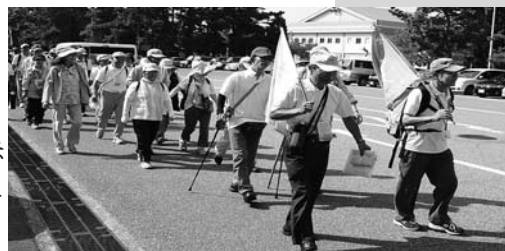
健民歩こう大会(健民祭ウォーク) H25.9.23

5月、10月を「歩こう走ろう強調月間」とし、歩こう・走ろう運動の普及を図るためそれぞれ精勤賞を設けています。