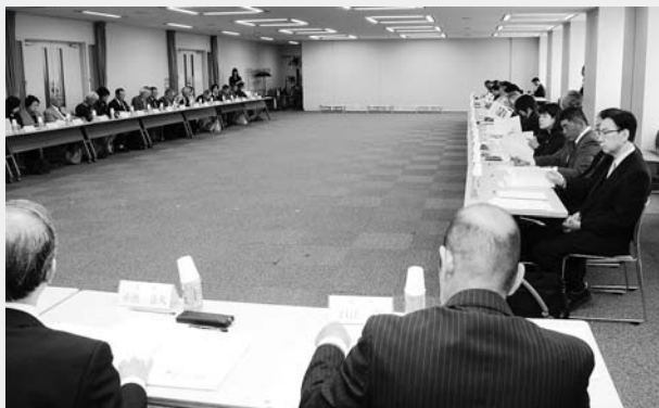
平成25年度 健民運動本部会 H25. 5. 16