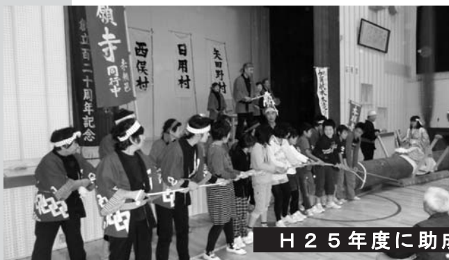
「加賀献木木遣り」の復活と保存・継承事業（小松市）