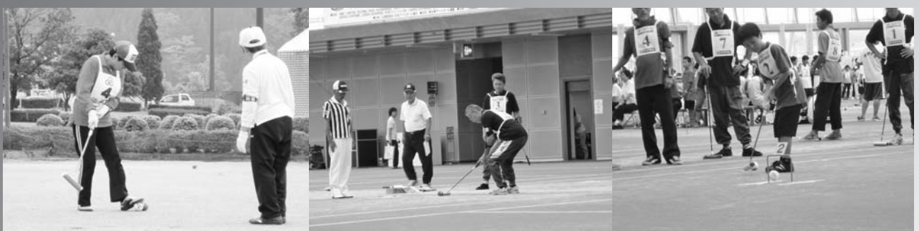
白山郷公園ゲートボール場 H25. 5. 19

和歌山国体からはゲートボール競技も公開種目になります。北信越ブロックからは男女4チームが参加予定です。さらに、来年は18箇国が参加する世界大会が新潟県で開催されます。現在のゲートボール競技は世界5大陸にわたって広く普及している、国際的なスポーツに成長しているのです。