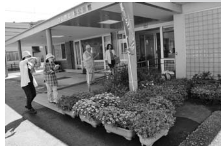
花や花壇の状況を詳細に審査

二日目の18日(水)は、野々市市の津田駒工業(株)野々市工場フローリストの大規模花壇の審査から始め、17箇所の花壇の審査を行いました。グループの担当者や花壇ボランティアの皆さんからは、「今年は異常気象で、水やりに苦労した上に、大雨にもたたられさんざんでした。」という声を一様にお聞きしました。