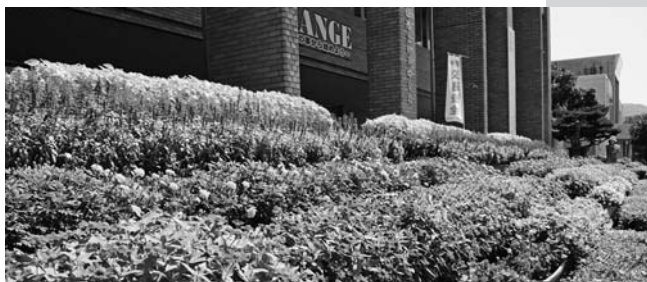
規模が大きく拡大した鶴来中学校の花壇を審査