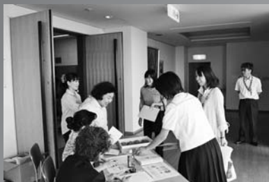
9.8 会場での受け付け風景

県大会で最優秀賞に輝いた主張は健民運動のかわら版にも載りますが、各地区大会にも多くの感動があります。実際に多くの方に来ていただくのが私たちの願いです。毎年8月から9月にかけて開催されていますので是非お越しください。