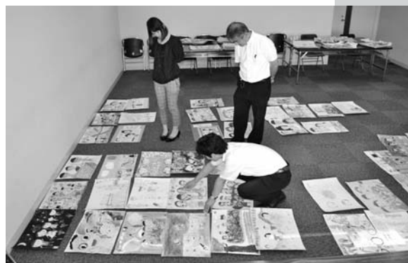
県庁での審査風景 9.18

9月18日(水)、県庁8階811会議室において、あたたかい家庭づくりを目指して県内の小中学生から募集した、平成25年度「家庭の日」作品コンクール〈絵画・ポスターの部〉の審査会を開催しました。応募作品は昨年より54点多い492点(85校)にのぼり、どれも夏休み中などに家族でした様々な体験や日常生活の一場面を、明るく楽しいタッチで描いた作品ばかりでした。慎重な審査の結果、最優秀賞1点、優秀賞5点、佳作12点が選ばれました。入賞作品は11月17日(日)から、花いっぱいコンクールの優秀花壇写真やつばめ総調査の作品などとともに県庁行政庁舎19階展望ロビーで展示します。お誘い合わせのうえご来場ください。