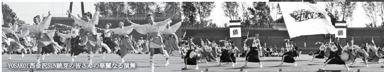
YOSAKOI 西金沢SUN跳芽の皆さんの華麗なる演舞