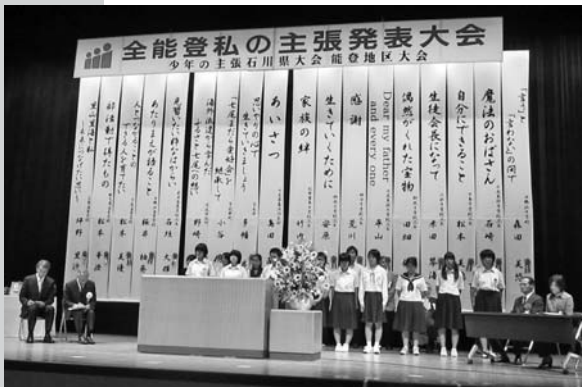
能登地区大会のステージ