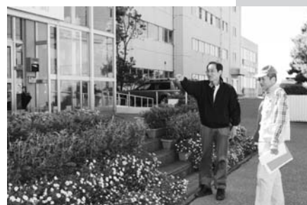
笠間中学校で花壇づくりのアドバイス

中には、いかにもぐったりとして疲れた様子でかわいそうな花壇も見られ、折角のご苦労を思いやると残念な気がしました。現地審査は、本部と「花の会」会員9人が手分けして行いました。今後、10月11日(金)に県庁で総合審査会を行い、11月17日(日)県庁19階展望ロビーにおいて、「花いっばいのつどい」を開催、優秀花壇を表彰するとともに、花壇の写真展を行う予定です。皆さんのご苦労の結晶が輝く写真展を是非ご覧ください。