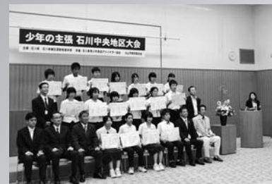
9.8 発表者と審査員の皆さん