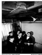
42年 進められた 42年 進められた 42年 進められた