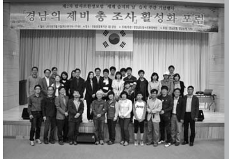
昌原市のフォーラム会場で 5月11日