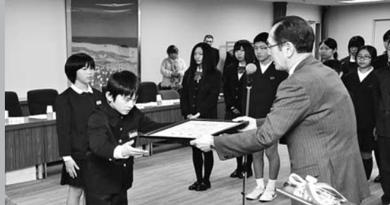
H24年度表彰式 H25. 1. 17

健民運動推進本部では、石川県と県教育委員会の後援で青少年ボランティア表彰を実施します。県内各地でひたむきに善行や献身的な活動に取り組んでいる青少年をご推薦ください。締切は6月28日(金)です。今回で19回目となる「青少年ボランティア表彰」は、平成7年1月の阪神・淡路大震災を機に、優れたボランティア活動を実践している青少年個人や団体を表彰して、ボランティアの輪が一層広がることを願って実施したものです。石川県では、その後ロシアタンカー油流出災害(H9)や能登半島地震(H19)などを経て、様々な分野におけるボランティア活動の大切さは、青少年にしっかりと根付いてきました。これまでに本表彰を受賞した個人は38人、団体は132団体にのぼっています。