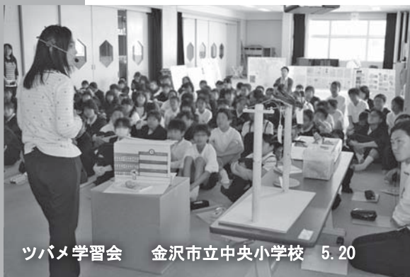
ツバメ学習会 金沢市立中央小学校 5.20

生活環境を見つめ、自然を愛護する心を育むことを目的として、県内すべての公立小学校6年生の児童の協力を得て、第42回ふるさとのツバメ総調査を5月10日（金）～16日（木）の愛鳥週間を中心に実施しました。今年度の結果は8月中旬に発表する予定です。また、健民運動推進本部では、平成17年から、この「ふるさとのツバメ総調査」に併せて、希望する小学校で「ツバメ学習会」を開催し、ツバメの生態や自然環境の保全などの理解を深める事前・事後学習に役立てていただいています。今年度の学習会は、事前学習として七尾市立東湊小学校など10の小学校、事後学習としては小松市立中海小学校と穴水町立向洋小学校の2校で開催しました。開催校は合計12校、約700人の児童が参加しました。昨年度比は5校、児童約500人の増加となり、環境保全などに対する関心の高まりが感じられました。また、児童が実施する地域の調査に同行して、地域のツバメの生息実態を調査するとともに、古くからツバメに親しみツバメを大切にする地域の方々のお話を伺い、42年間継続する本県の「ふるさとのツバメ総調査」が地域の絆を深める機会となっていることを改めて考えさせられました。