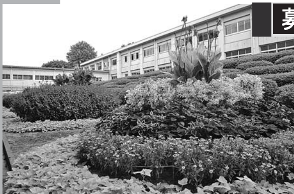
昨年度最優秀花壇（中能登町立鹿島中学校）