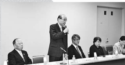
健民運動推進本部本部会 5.16