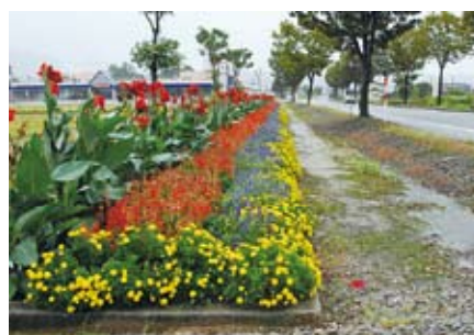
優秀賞 一般の部：花の会・ 鶴来(フラワーロード鶴来)(白山市)