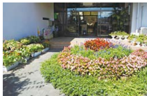
優秀賞 幼少年の部：七尾市社会 事業協会西湊保育園 (七尾市)