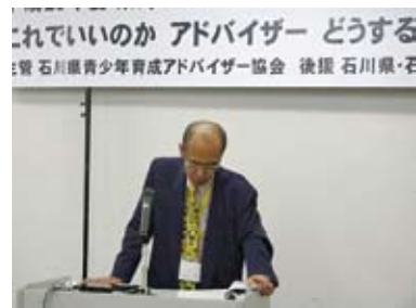
<開会挨拶をする多賀県青少年育成アドバイザー協会会長>