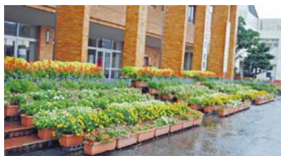
優秀賞 中学校の部：鶴来中学校(白山市)