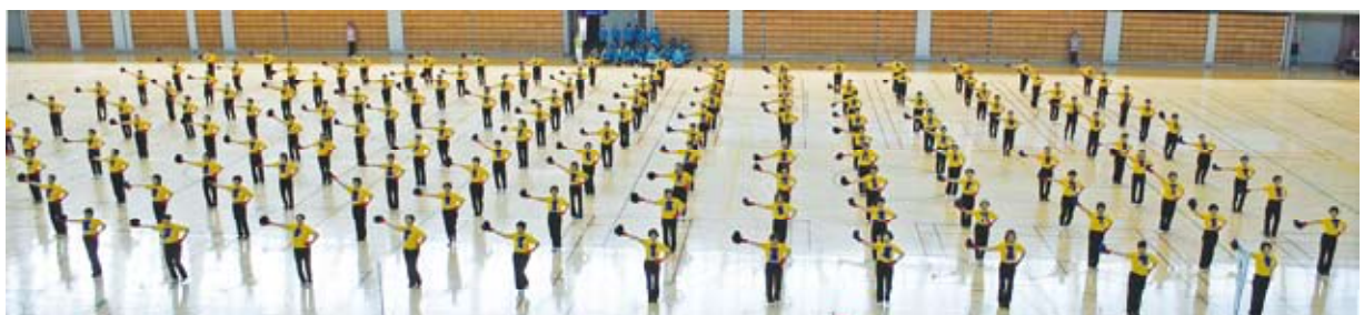
<157名による松任スポーツクラブのクラブ発表>