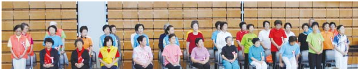
<35名の健康クラブ推進功労者のみなさん>