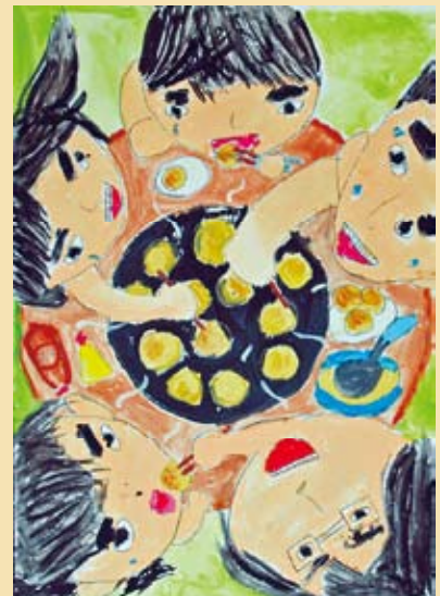
<「家庭の日」絵画・ポスターコンクール 最優秀賞受賞作品：9ページ参照>