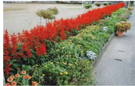
優秀賞 一般の部： 軽海町女性部（小松市）