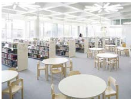
<児童図書コーナー>

その名を『金沢海みらい図書館』と言います。場所は海側環状線と金石街道の交差点近くです。知らない人は、『あの建物は何？』と聞く特徴のある建造物です。白い箱型の大きな外壁一面に、丸い光取り窓が水玉模様のように並んでいます。1階は子どもたちのみらいのための児童書コーナーと250席もある交流ホールやギャラリー・集会室があり、3階には海＝日本海関連図書コーナーがあります。中央にあるらせん階段や円窓からの自然光で明るく、2階から3階への大きな吹き抜けにより解放感たっぷりの図書館です。