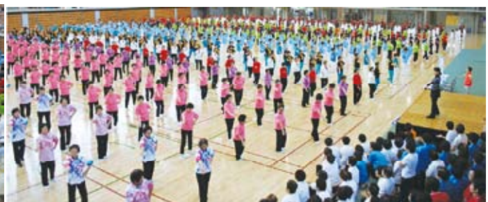
<全体演技(リズム体操)>