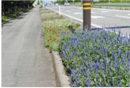
優秀賞 一般の部：北陸日本電気 ソフトウェア（株）（白山市）