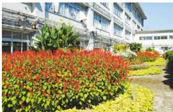
最優秀賞 中学校の部：鹿島中学校(中能登町)