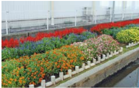
優秀賞 一般の部： 小松市農業協同組合（小松市）