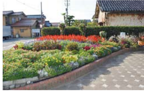
優秀賞 一般の部：J A 小松市今江町女性部（小松市）