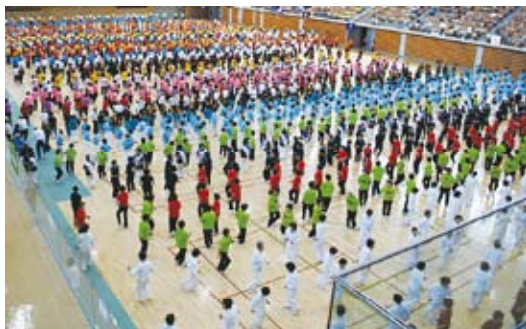
<2100余名の健民さわやか体操>