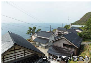
白壁・黒瓦の家並み