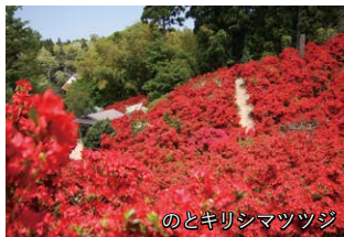
のとギリシマツツジ