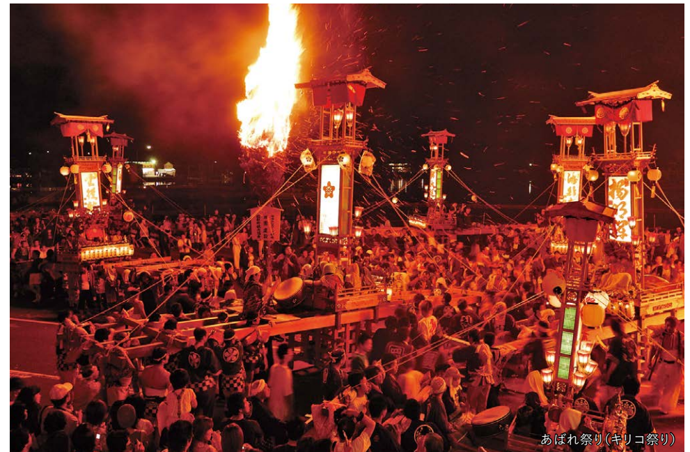
あばれ祭り(キリコ祭り)