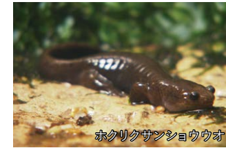
ホクリクサンショウウオ