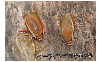
シャープゲンゴロウモドキ