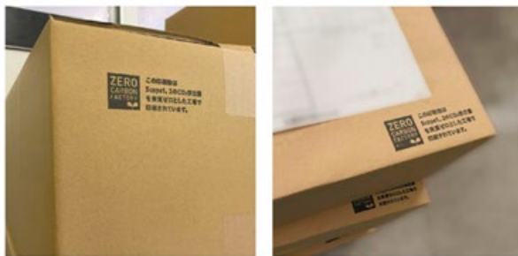
該当製品の外装にはマークがつきます