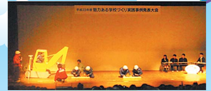
魅力ある学校づくり実践事例発表大会 (平成23年11月7日 文教会館) 小・中・高校の6校が発表 県立学校では、羽咋工業高校、宝達高校が発表

今後とも、このような取組を通して生徒や保護者、地域に愛される魅力ある県立学校づくりを進めます。