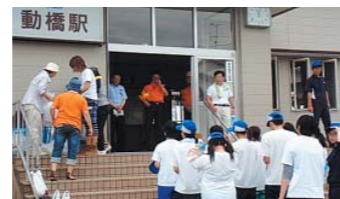
動橋駅での清掃活動

校内外の清掃活動や地域との交流活動を通して、成功体験や達成感を味わう機会を増やし、向上心や自己肯定感を育むことで学習習慣を定着させ、基礎学力の向上を目指します。