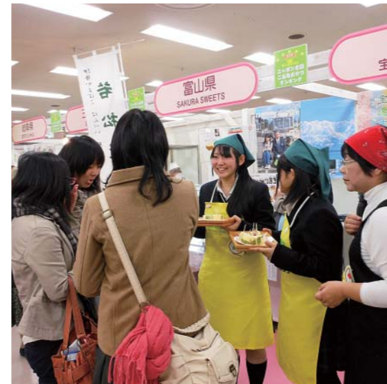
地元菓子店との連携による販売活動(東京・全国物産展)

創作菓子「ジュエルスイーツ」などの商品開発・販売実習に係る高校生コンサル活動の展開や、地域の小中学校と連携した宝達山クリーン登山等の地域貢献活動により、地域の未来を担う人づくりを目指します。