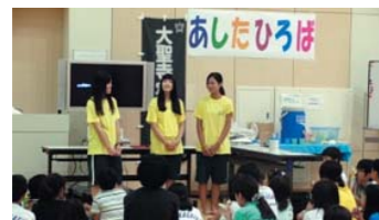
仙台大学で行われた被災地との交流

地域食材である葛の商品化を図り、その売上げの一部を被災地支援にあてることと、次の商品開発にあてるビジネスモデルを構築します。