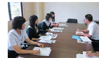
中能登町役場への訪問

新聞を活用した学習やニッチトップ企業、市町役場の訪問を通して、ふるさと石川の現状と課題を探り、愛着を深めることにより、地元で役立つとする人材の育成を図ります。