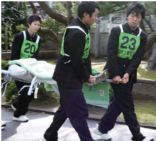
地域共同避難訓練

工業高校各学科の専門性を生かして、防災用具・保管所等を製作し、学校に備えるとともに、地域に提供する取組を通して、社会貢献に対する意識の向上を図ります。