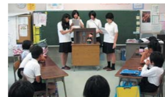
小学校での読み聞かせ活動

地域の民話・伝承等の掘り起こし活動や読み聞かせ活動、朝読書のレベルアップ等を通して、情報活用能力、コミュニケーション能力等の育成を図ります。