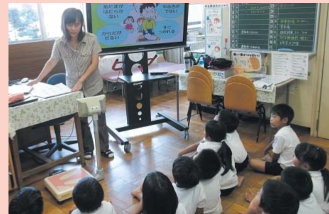
栄養教諭による朝食の指導（野々市市立富陽小学校）

いしかわ教育の日 シンボルマーク 発行・編集/石川県教育委員会 金沢市鞍月1-1 TEL (076) 225-1811 http://www.pref.ishikawa.lg.jp/kyoiku/index.html