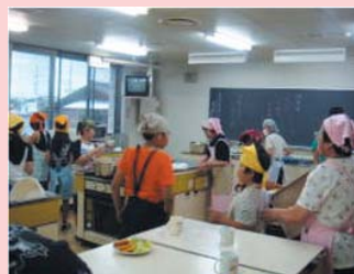
(通学合宿：夕食づくりの様子)