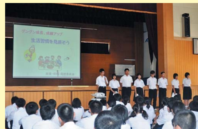
生徒会による生活習慣改善の発表（七尾市立御祓中学校）