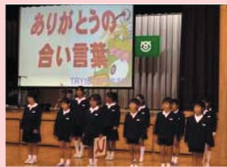
(児童による「絆宣言」の様子)