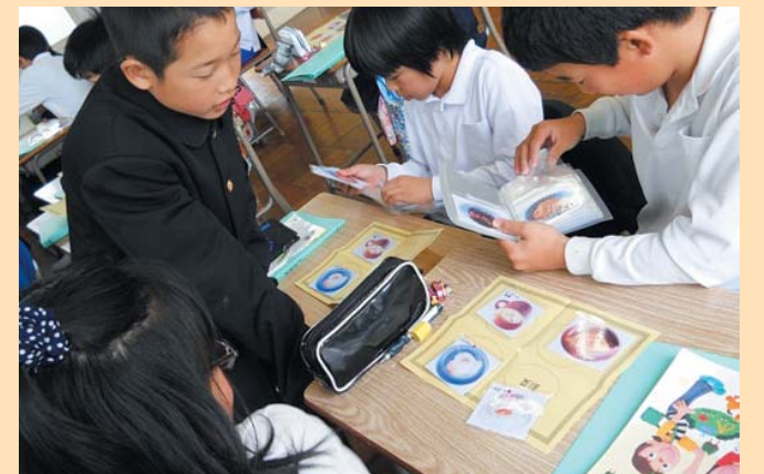
朝食の献立づくり（加賀市立錦城小学校）