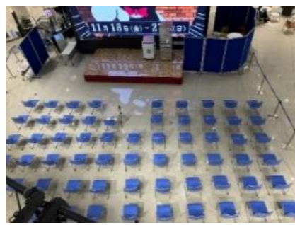
開閉会式および発表会のイメージ