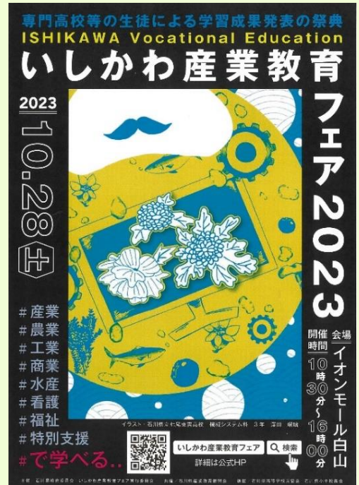
いしかわ産フェア2023ポスター (七尾東雲高校生徒の最優秀作品)