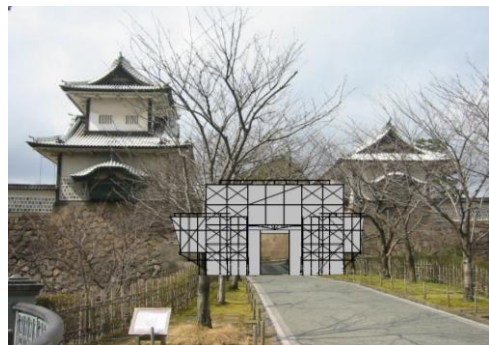
足場・覆いイメージ