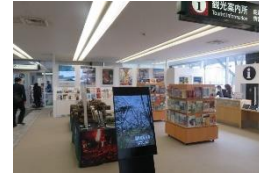
能登の旅情報センター