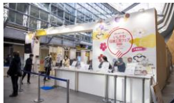
いしかわ伝統工芸フェア