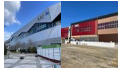
北陸新幹線駅舎整備