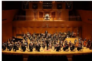
県立音楽堂開館20周年記念公演