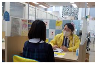
ILAC窓口での相談対応