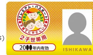
2子世帯用プレミアム・パスポート