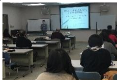
日本語指導ボランティア養成講座