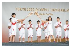
東京2020オリンピックトーチキスラリー