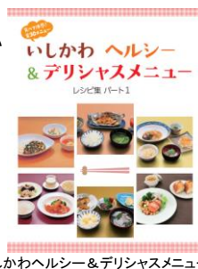
いしかわヘルシー&デリシャスメニュー