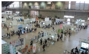
インターンシップマッチング交流会