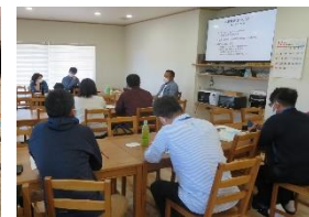
石川地域づくり塾