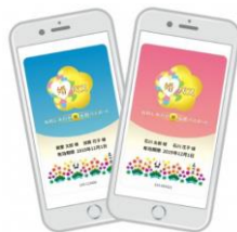
「石川しあわせ婚応援パスポート」