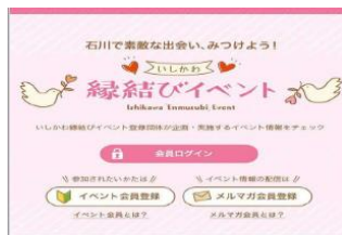
婚活イベント専用サイト「いしかわ縁結びイベント」