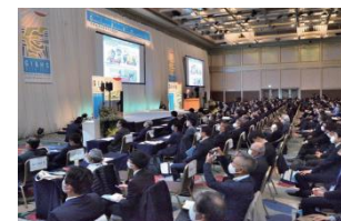
世界農業遺産国際会議2021