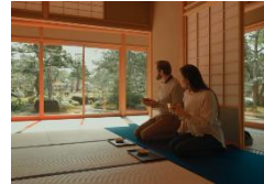
SNSを活用した海外への情報発信