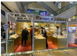
海外アンテナショップ(シンガポール)