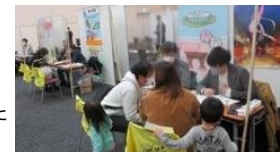
いしかわUターン大相談会