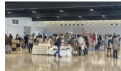
金沢港クルーズターミナルでのイベント