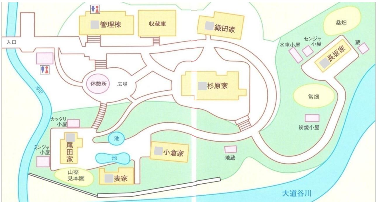
《 民俗資料館の地図 》