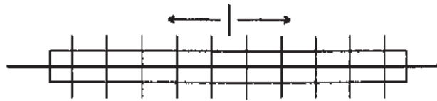
図 4 - 1 ボルト締付け順序